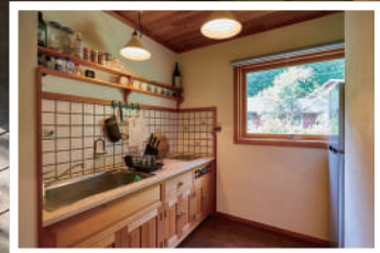
1、2階合わせて3部屋と畳部屋も備えているので、大人数の宿泊でも安心です。