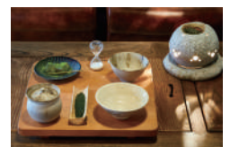
5種類の煎茶から選べます。お点前セット540円〜。

1820年創業の老舗お茶問屋。無農薬有機栽培でお茶の生産・加工・販売までを行っています。茶園ならではの様々なお茶を購入できることはもちろん、茶蔵を改装した和モダンなイートインスペースではお茶を使ったスイーツ等も提供しています。