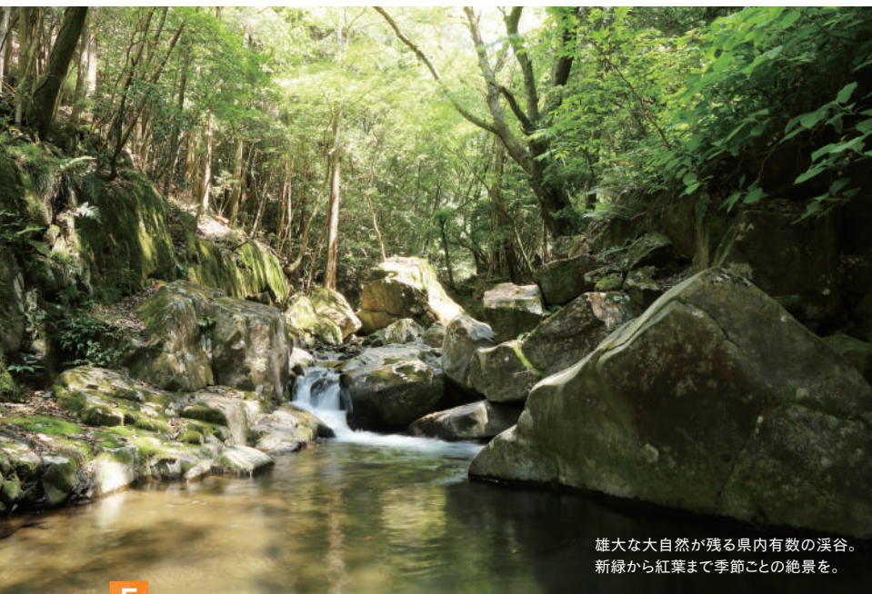
雄大な大自然が残る県内有数の渓谷。新緑から紅葉まで季節ごとの絶景を。